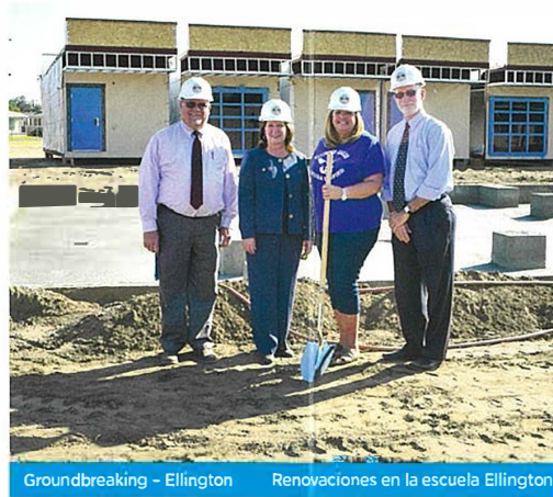
Groundbreaking - Ellington Renovaciones en la escuela Ellington

Measure K funded the replacement of Center Middle School's roof after the District identified the project as among its greatest facilities needs.