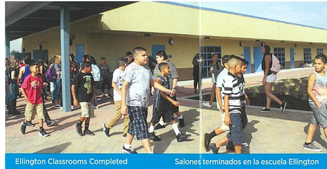
Ellington Classrooms Completed Salones terminados en la escuela Ellington